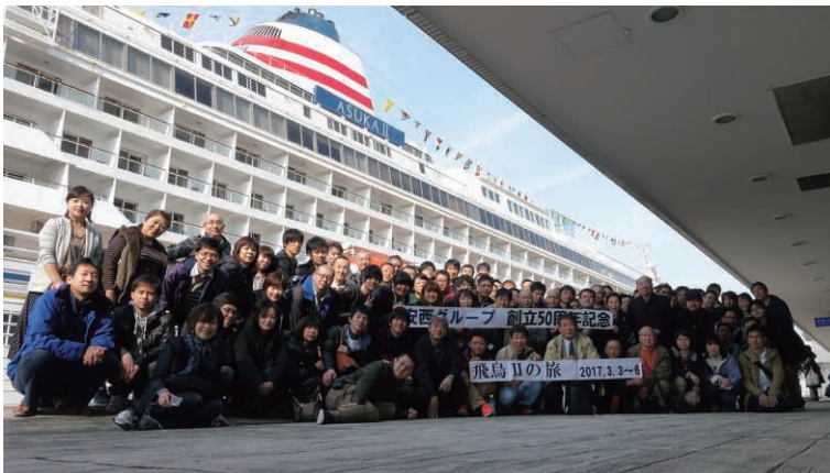
創立50周年記念社員旅行(飛鳥IIクルーズ)

我社は大変ユニークでレアなものづくりに取り組んでおり、お客様の様々な「困った」を解決してきました。形や結果を出すことを目標に社員全員で力を合わせています。新入社員のほとんどは入社前に選別機についての知識が全くありませんが、先輩社員が一人ひとりから丁寧に指導しますので、一年目から立派な戦力となり活躍できるようになります。新卒3年以内の離職率が5.3%と非常に低く定着率の良い会社と言えます。また、景気の好不況に左右されることがなく安定した売上・利益を維持しており、創業以来の無借金・黒字経営を続けています。現在千葉本社では新工場を建設中(2023年竣工予定)。綺麗で一層快適な環境になります。